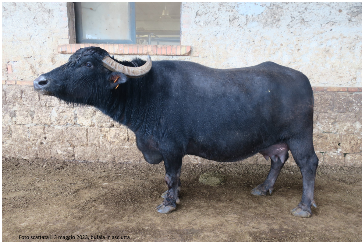
Foto scattata il 3 maggio 2023, bufala in asciutta