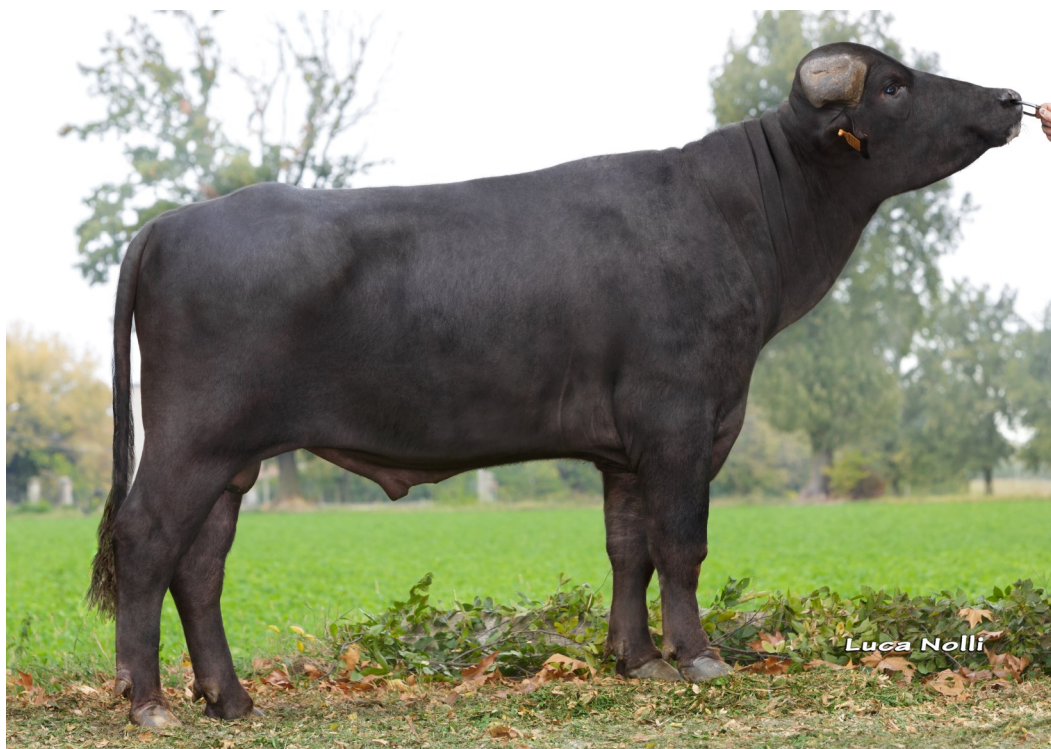
IT004991408077 URANIO - 1,30 mamacoin/day